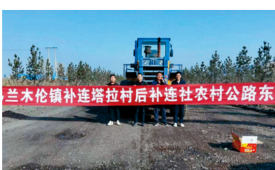
乌兰木伦镇补连塔拉村后补连社农村公路东段项目工程

4月1日,由集团公司承建的乌兰木伦镇补连塔拉村后补连社农村公路东段项目工程(以下简称:项目)开工建设。本项目